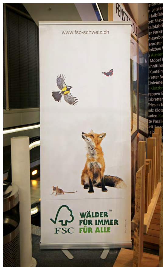
Roll-up FSC à Swissbau 2016