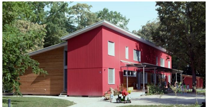
Kindergarten «Hauental» in Schaffhausen (2008)

Siehe dazu Factsheet: FSC® Projektzertifizierung