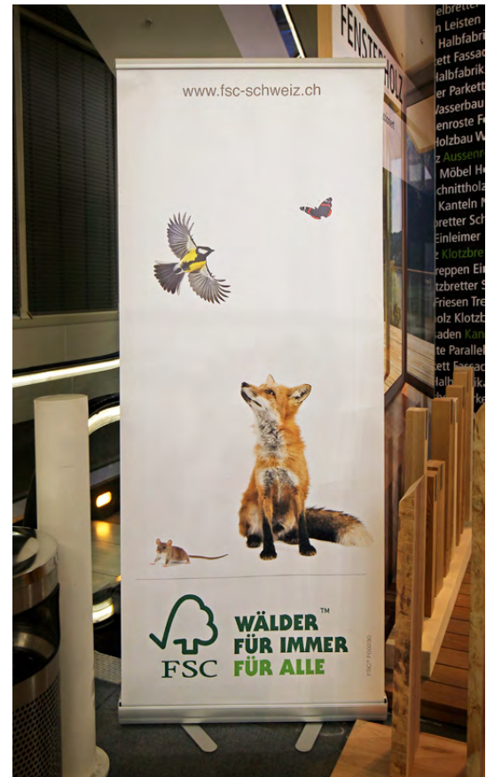
FSC-Rollo an der Swissbau 2016